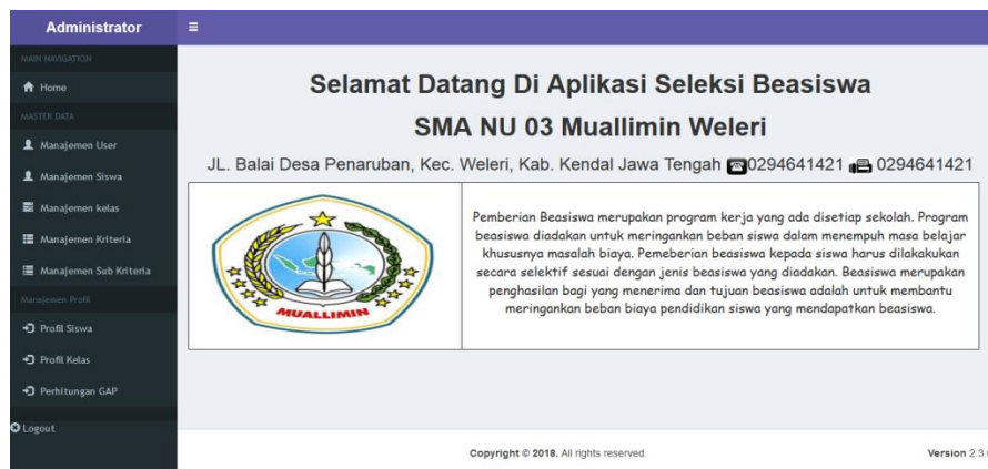
Gambar 3 Tampilan Halaman Awal