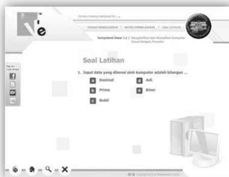
Gambar. Halaman Soal Latihan