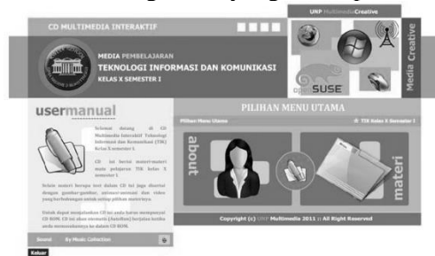
Gambar. Halaman User Manual

Halaman User Manual adalah komponen dalam CD Multimedia Interaktif yang menyambut pengguna dan memberikan informasi penting tentang konten serta fitur yang ada. Halaman ini dirancang untuk memberikan panduan awal mengenai penggunaan CD multimedia, termasuk penjelasan tentang fungsi-fungsi yang tersedia dan cara navigasi. Halaman ini juga sering kali memuat petunjuk atau tips yang mempermudah pengguna dalam memanfaatkan semua fitur yang ada. Ditempatkan di dalam file Home.swf, halaman User Manual menyediakan informasi dasar yang diperlukan untuk memulai eksplorasi CD multimedia. Untuk memahami tata letak dan tampilan halaman ini, lihat gambar yang terlampir.