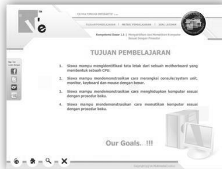
Gambar. Halaman TujuanPembelajaran

b. Tombol Materi Pembelajaran adalah fitur dalam CD Multimedia Interaktif yang memberikan akses ke berbagai materi yang akan dipelajari. Tombol ini mengarahkan pengguna ke halaman-halaman yang berisi topik-topik atau bagian-bagian materi yang terstruktur untuk pembelajaran. Halaman Materi Pembelajaran biasanya terdiri dari beberapa halaman yang saling terhubung. Untuk memudahkan navigasi, disediakan tombol navigasi yang memungkinkan pengguna berpindah ke halaman berikutnya atau kembali ke halaman sebelumnya. Tombol-tombol ini dirancang untuk mempermudah eksplorasi materi secara berurutan dan memastikan akses yang lancar ke seluruh konten. Untuk informasi lebih lanjut mengenai tampilan dan fungsi halaman Materi Pembelajaran, lihat gambar yang tersedia.