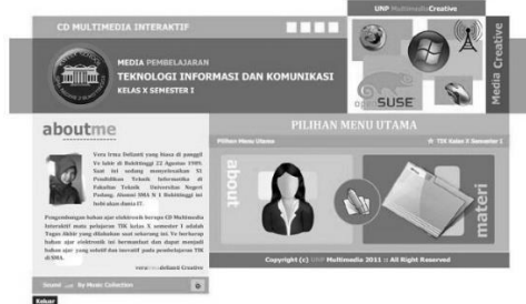
Gambar. Halaman About

tim yang terlibat dalam pembuatan program, termasuk latar belakang, kontribusi, dan informasi kontak jika diperlukan. Halaman ini terletak dalam file Home.swf dan memberikan wawasan serta transparansi mengenai pihak yang mengembangkan CD multimedia. Untuk mengetahui lebih lanjut mengenai desain dan isi halaman ini, periksa gambar yang tersedia.