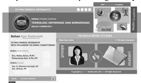
Gambar. Halaman Menu Utama

Halaman Menu Utama adalah tampilan pertama yang muncul dalam CD Multimedia Interaktif, berfungsi sebagai pintu masuk bagi pengguna untuk mengakses berbagai fitur dan konten yang ada. Halaman ini dilengkapi dengan lima tombol navigasi yang memungkinkan pengguna berpindah ke berbagai bagian dari CD multimedia. Penempatan tombol-tombol ini dilakukan secara strategis untuk mempermudah akses dan meningkatkan pengalaman pengguna. Halaman Menu Utama disimpan dalam file yang bernama Home.swf. Untuk memahami lebih lanjut tentang tata letak dan tampilan halaman ini, periksa gambar yang terlampir.