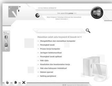
Gambar. Halaman Searching