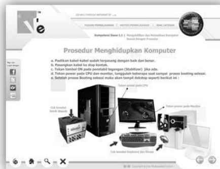
Gambar. Halaman Materi Pembelajaran

b. Tombol Materi Pembelajaran adalah fitur dalam CD Multimedia Interaktif yang memberikan akses ke berbagai materi yang akan dipelajari. Tombol ini mengarahkan pengguna ke halaman-halaman yang berisi topik-topik atau bagian-bagian materi yang terstruktur untuk pembelajaran. Halaman Materi Pembelajaran biasanya terdiri dari beberapa halaman yang saling terhubung. Untuk memudahkan navigasi, disediakan tombol navigasi yang memungkinkan pengguna berpindah ke halaman berikutnya atau kembali ke halaman sebelumnya. Tombol-tombol ini dirancang untuk mempermudah eksplorasi materi secara berurutan dan memastikan akses yang lancar ke seluruh konten. Untuk informasi lebih lanjut mengenai tampilan dan fungsi halaman Materi Pembelajaran, lihat gambar yang tersedia.