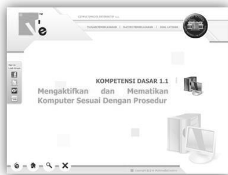
Gambar. Halaman Materi

Halaman Materi adalah bagian utama dalam CD Multimedia Interaktif yang menyajikan konten inti untuk dipelajari. Halaman ini berfungsi sebagai pusat dari CD multimedia, dirancang untuk menampilkan berbagai materi edukatif atau informasi penting yang menjadi fokus utama. Konten yang disajikan di halaman Materi biasanya meliputi teks, gambar, video, dan elemen multimedia lainnya yang relevan dengan topik yang dibahas. Tujuan dari desain halaman ini adalah untuk mempermudah pengguna dalam mengakses dan berinteraksi dengan materi serta menyediakan navigasi yang jelas untuk berpindah antar bagian atau topik. Untuk melihat lebih detail mengenai tata letak dan tampilan halaman ini, periksa gambar yang terlampir.