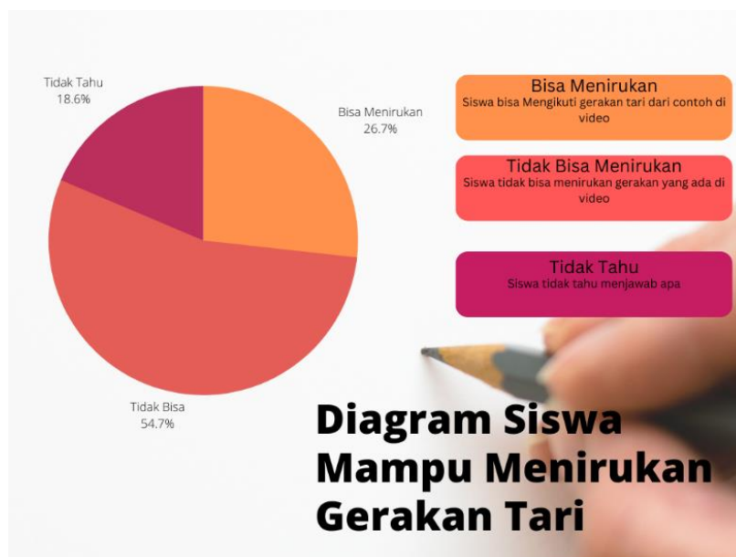
Gambar 9. Diagram Siswa Mampu menirukan Gerakan Tari

Pada gambar 8 sebanyak 72,1% siswa memahami isi yang terdapat pada aplikasi karena berupa tulisan yang jelas ataupun berupa video , dengan banyak warna dan model pembelajaran yang berbeda menarik mereka untuk lebih memahami, tetapi 11,6 % tidak memahami karena memilih lebih suka di jelaskan oleh guru tentang pembelajarannya sedangkan 16,3 % mengkosongin jawaban atau menjawab tidak tahu.