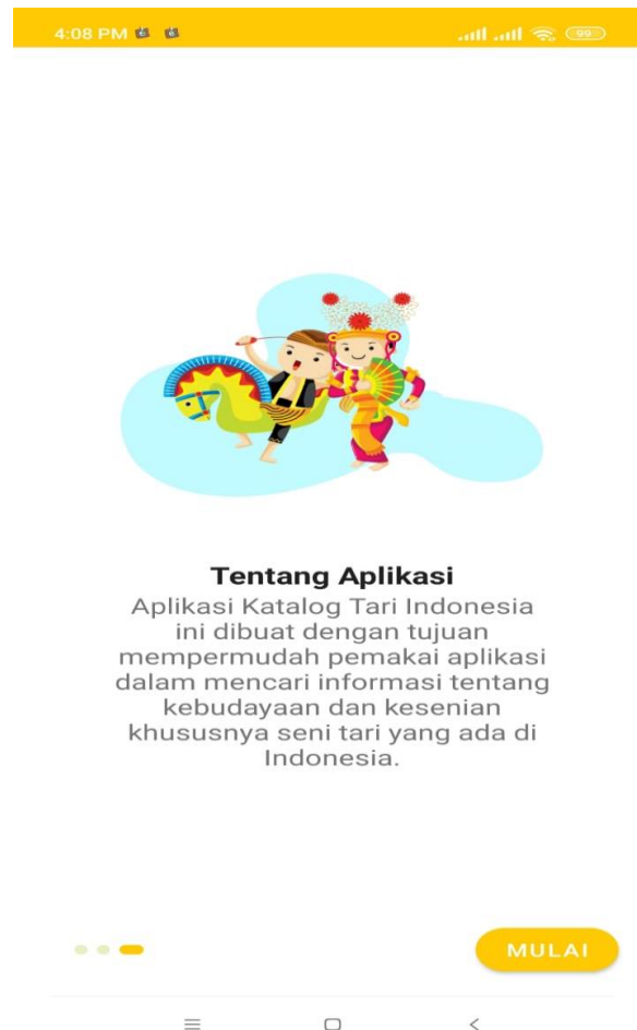
Gambar 3. Gambar Introslider

Pada sistem yang di kembangkan terdapat beberapa tampilan yang memiliki informasi pendidikan seperti pada gambar 3 di bawah ini yang merupakan tampilan menu jenis tarian