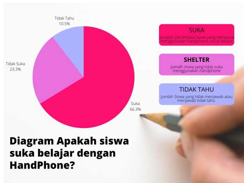
Gambar 7. Diagram siswa yang suka belajar dengan Handphone

Pada Gambar 6. Terlihat gambar video gerakan seni tari yang bisa di amati oleh siswa tentang gerakan seni tari , karena belajar seni tari menggunakan buku tidak ada gambaran seni tari nya.