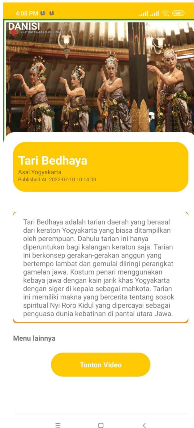
Gambaran 5. Detail Tarian

Pada gambar 5 terdapat penjelasan tentang tarian, sejarahnya, dan asal usul serta penggunaan tarian ini biasa digunakan pada saat dan momen tertentu. Sedangkan untuk lebih memahami gerakan dan jenis tarian yang dipakai siswa bisa menekan tombol tonton video yang akan menampilkan video gerakan tarian.