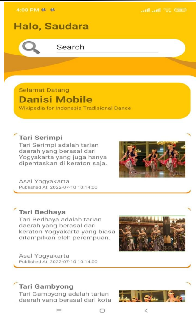
Gambar 4. Menu Utama

Dalam Gambar 4 terdapat form pencarian tarian dan list view dari jenis tarian yang ada, di dalam info data tarian ini terdapat gambar tarian dan penjelasan singkat mengenai tarian. Di dalam halaman ini berupa scroll ke bawah yang berisi banyak tarian yang ada dalam aplikasi, akan tetapi bisa dilakukan pencarian juga melalui menu pencarian.