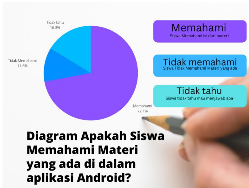
Gambar 8. Diagram apakah siswa memahami isi yang terdapat pada aplikasi

Dari gambar 7 terlihat 86 siswa yang menjadi responden terhadap aplikasi yang di buat 66,3% mengatakan suka menggunakan handphone untuk belajar dengan berbagai alasan , antara lain nya adalah handphone selalu di bawa siswa sehingga ketika ingin belajar bisa langsung dilakukan, adalagi yang mengatakan lebih enak karena modern , dan lain sebagainya dengan berbagai alasan. Sedangkan 23,3% mengatakan lebih menyukai buku untuk belajar , sisa nya sebanyak 10,5% tidak tau ingin menjawab apa atau mengkosongin jawaban nya.