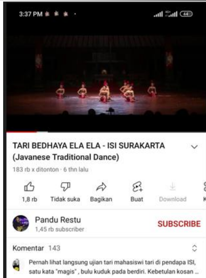
Gambar 6. Video Seni Tari

Pada Gambar 6. Terlihat gambar video gerakan seni tari yang bisa di amati oleh siswa tentang gerakan seni tari , karena belajar seni tari menggunakan buku tidak ada gambaran seni tari nya.