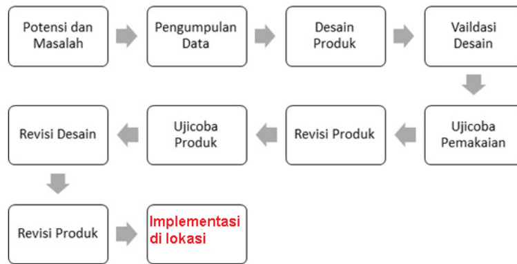
Gambar 1. Langkah-langkah Metode R & D